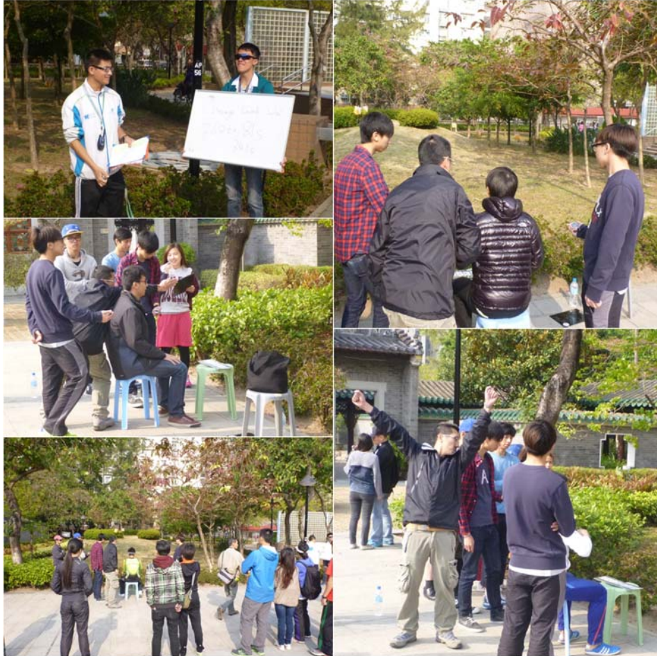
香港沿徑定向錦標賽 2013 速決賽實況

香港定向總會 Orienteering Association of Hong Kong